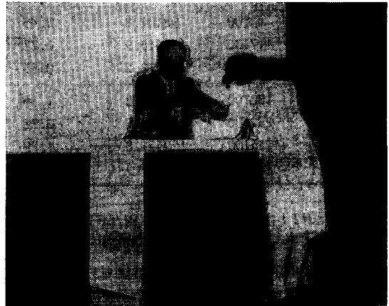
学生論文賞表彰式

会場となった早稲田大学大久保キャンパスは、建物の内部構造が非常に複雑になっており、筆者のように方向音痴の者には、到底2日間で理解できるたぐいのもではなかったが、行く先等の掲示が綿密になされており、ほとんど迷うことがなかったのは非常にありがたかった。また発表スケジュールのコピーが多くの場所に掲示してあり、次に行く会場を決定するのにいちいちアブストラクト集を出す手間がかなり省けたのもたいへんよかった。